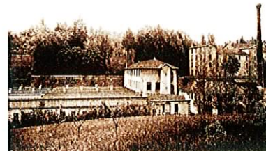
LA COMBE LES EPARRÉS - Ulise Girard

Découverte de l'histoire industrielle des usines de La Combe Les Eparres, et de la vie rurale sur Les Eparres.